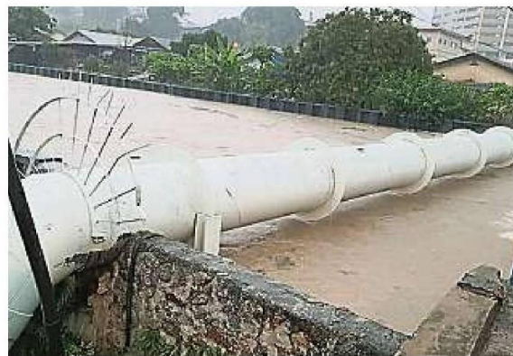
无拉港新村峇拉河的水位明显高涨。

据了解，无拉港新村、首都镇第四区、万年花园、金沙花园等地方均面对不同程度的水灾。