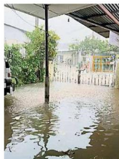
积水流入家中,让居民感到无奈。

此外,马来亚铁道公司(KTM)也在脸书发帖指出,沙登火车站的服务因水灾原因被迫暂时中断,火车将在其前后一站,即南湖镇(Bandar Tasik Selatan)或加影站折返。