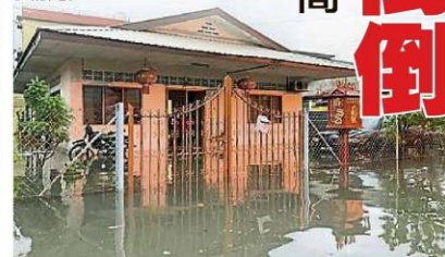
沙登新村第9区的积水情况。