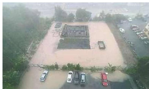
无拉港多区傍晚面对豪雨造成的闪电水灾问题。