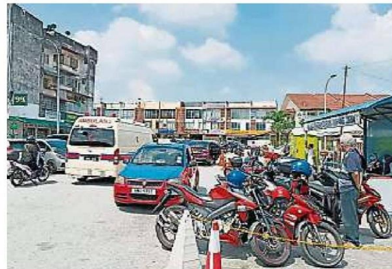
德士、摩托车和轿车堵在诊疗所大门处,救护车要进入也面对问题。