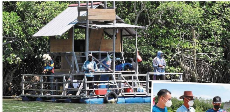
Visitors to Sirip Biru Jetty can rent a raft house and enjoy fishing from there. — Photos: LOW LAY PHON/The Star

Campaign to help local tourism industry recover from pandemic