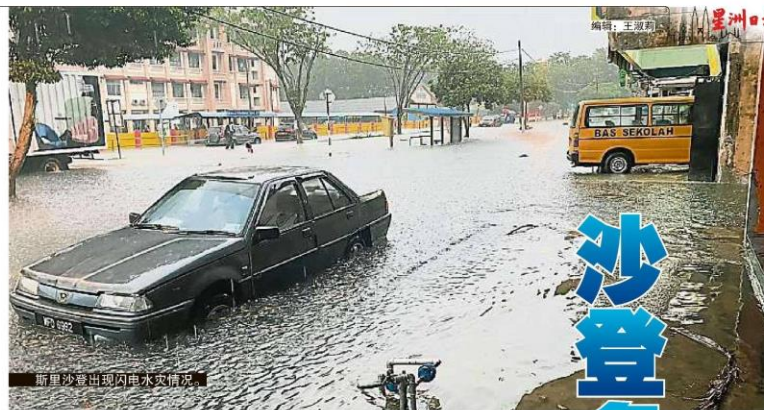
新里沙登出现闪电水灾情况