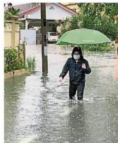
部分地区的水位一度达到成年人膝盖位置。

(沙登1日讯)午后豪雨,加上两小时的降雨量达127毫米,又再造成沙登多个地区传出闪电水灾和数宗树倒报! 据了解,这次发生闪电水灾的地点包括古腰路(Jalan Kuyoh)、金马7路(Jalan Jinma 7)、沙登岭部分地区、沙登新村的SK5/2路、SK9/6路及沙登拉也的乌达玛路、沙登怡观园一带和斯里沙登部分地区等。同时,在沙登火车站前的双向车道也因积水而无法通车,部分车辆和摩托车纷纷被迫转进商区等水退,导致该路出现车龙。 据了解,尽管沙登火车站前双向车道在以往是“积水灾区”,但在近期的闪电水灾中,都没有再重演积水,但今年雨量太大,最终再发生水灾。